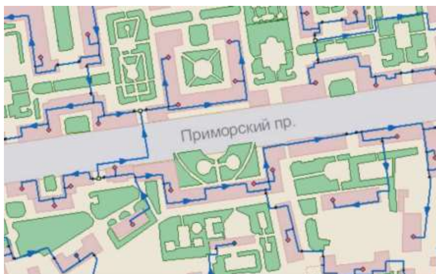
Рисунок 8.3. Карта с загруженными векторными слоями

Простые графические объекты содержат все атрибуты отображения внутри себя. Типовые графические объекты содержат лишь ссылку на типовую структуру, которая и определяет графический тип, атрибуты отображения и текущее состояние объекта (такие объекты, как правило, используют при нанесении инженерных сетей).