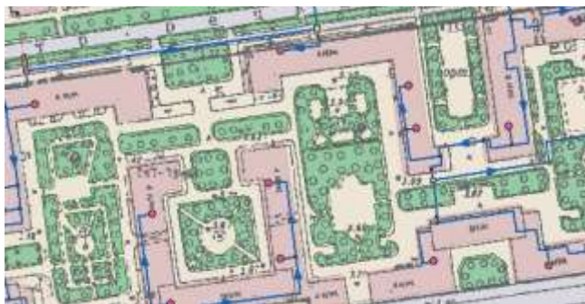
Рисунок 8.6. Пример карты с загруженными слоями

Разработчики приложений могут получить доступ ко всем параметрам карты через объект MapDoc.